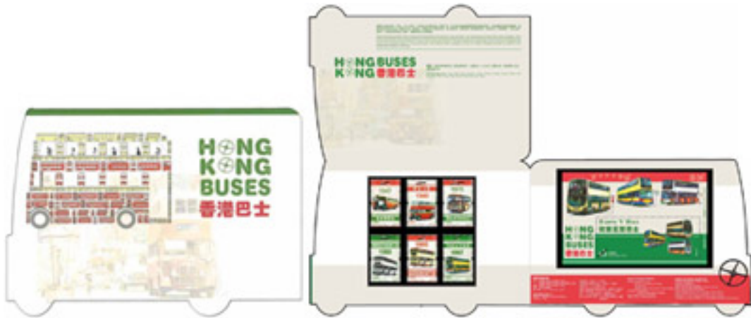
套摺 (內外設計圖樣)