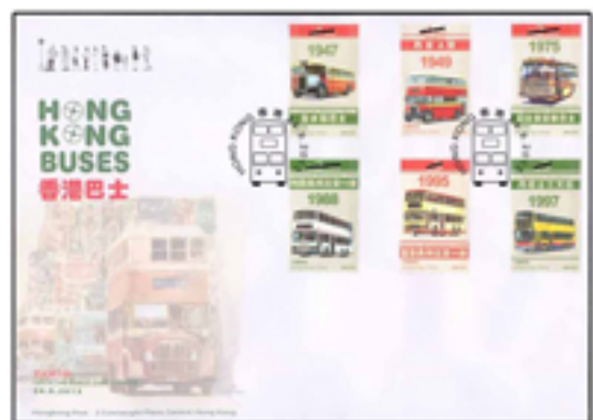
已蓋銷首日封連一套六枚郵票 (特別郵戳)