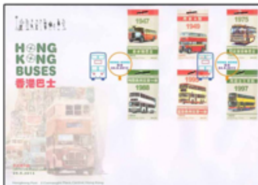
已蓋銷首日封連一套六枚郵票 (彩色郵戳)