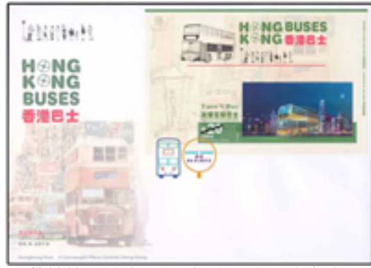
已蓋銷首日封連 20 元郵票小型張 (彩色郵戳)