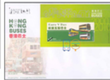
一套三個已蓋銷首日封連珍貴郵票小冊子郵票小型張 (彩色郵戳)