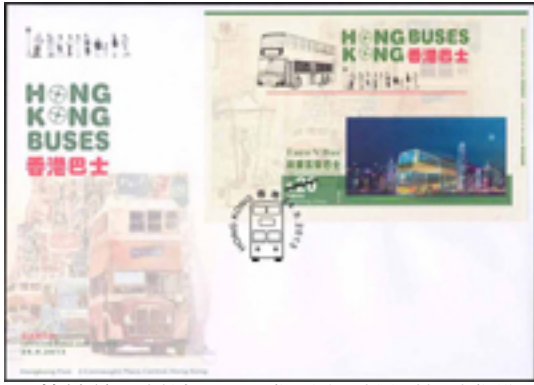
已蓋銷首日封連 20 元郵票小型張 (特別郵戳)