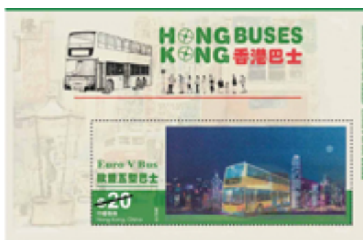
郵票小型張 (附光柵效果)