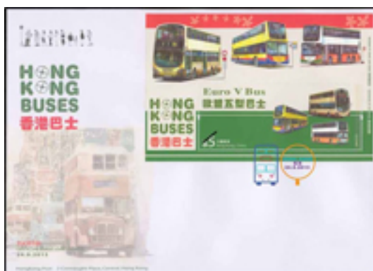
已蓋銷首日封連 5 元郵票小型張 (彩色郵戳)