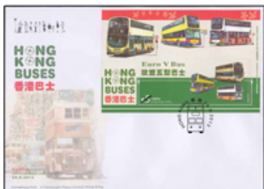
已蓋銷首日封連 5 元郵票小型張 (特別郵戳)