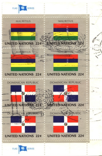
蓋消聯合國徽號郵戳印