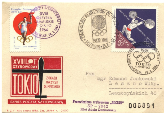
1964 波蘭共和國名片，蓋第 18 屆東京奧林匹克運動會紀念郵戳