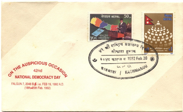
1992 年慶祝尼泊爾 42 週年民主日紀念首日封

通常的國旗是長方形，比例為 2:3, 1:2 或 3:5。但尼泊爾的國旗是用兩個三角形組合，縱橫比例為 4:3。因此，尼泊爾國旗是唯一三角形的國旗和唯一縱大於橫的國旗。