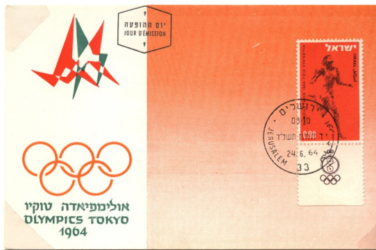
郵票附邊印有國際奧林匹克「五環旗」