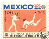
第 19 屆墨西哥奧林匹克運動會