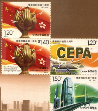
香港和中國郵政聯合發行小型張