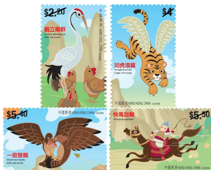
兒童郵票—成語動物園