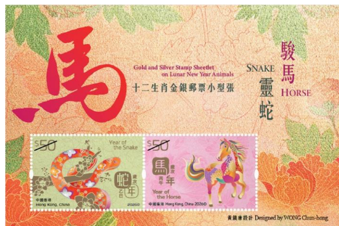
十二生肖金銀郵票小型張—靈蛇駿馬