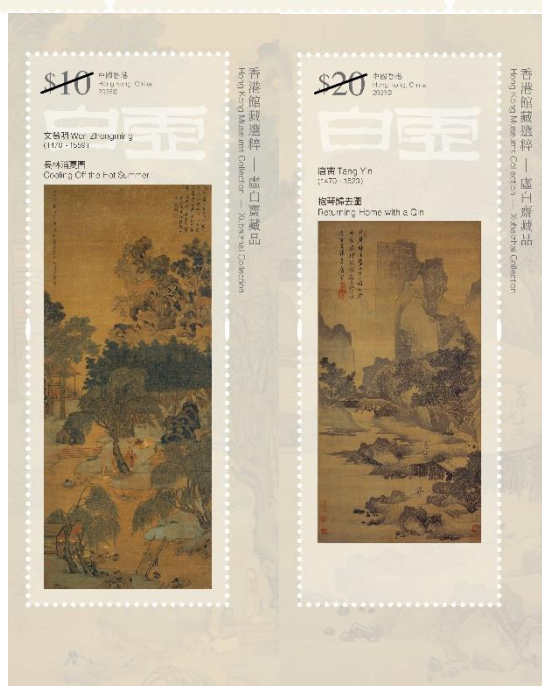
香港館藏選粹—虛白齋藏品