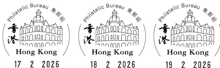
郵戳式樣(只供參考)

由現在至2026年2月11日，顧客可申請本署的「自行設計紀念封代貼郵票/蓋銷服務」，在其自備紀念封貼上郵票和蓋上2026年2月17日至19日集郵組圖案郵戳。