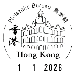
郵戳式樣(只供參考)

由現在至 2025年12月31日 ，顧客可申請本署的「自行設計紀念封代貼郵票/蓋銷服務」，在其自備紀念封貼上郵票和蓋上 2026年1月1日 集郵組圖案郵戳。