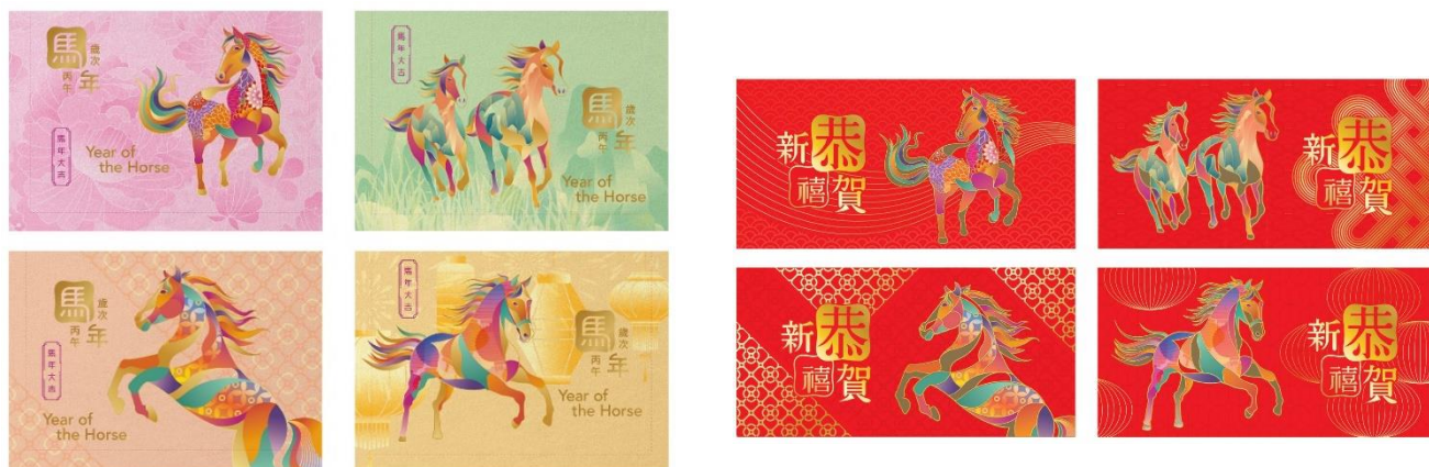
郵資已付生肖賀年卡（空郵郵資）（一套四張）