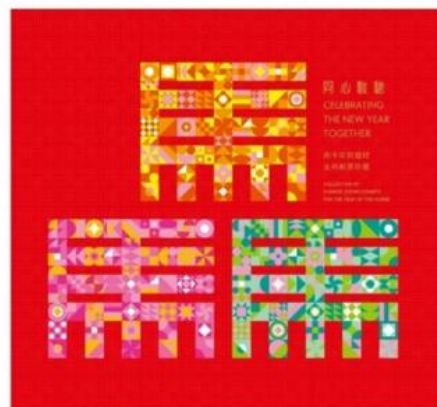
聯合紀念套摺（珍藏版）