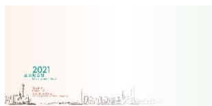
2021 年纪念封 (小型尺寸: 220 毫米 x 110 毫米)

全新设计的“2021 年纪念封”将会由二〇二一年一月十四日至十二月三十一日在 38 间集邮局和香港邮政网上购物坊-「邮购网」发售，每个售价二元。