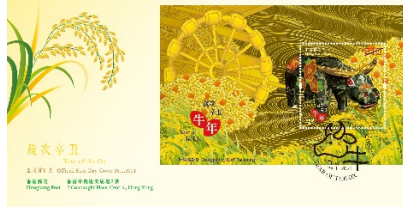
贴有一张面值 10 元的邮票小型张并以特别邮戳盖销的首日封 (珍藏版)