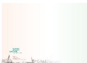
2021 年纪念封 (中型尺寸: 228 毫米 x 162 毫米)