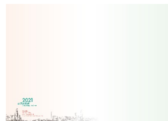
2021 年纪念封 (大型尺寸: 265 毫米 x 190 毫米)