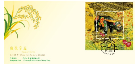
贴有一张丝绸邮票小型张并以特别邮戳盖销的首日封 (珍藏版)