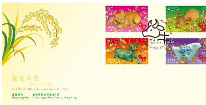
贴有一套四枚邮票并以特别邮戳盖销的首日封 (珍藏版)