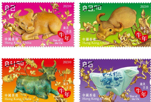
岁次辛丑（牛年）— 邮票