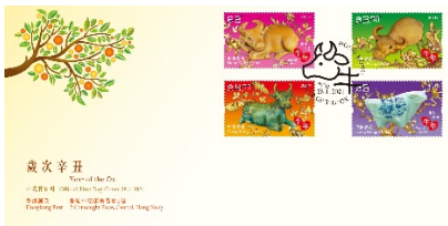
贴有一套四枚邮票并以特别邮戳盖销的首日封