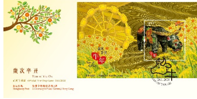
贴有一张面值 10 元的邮票小型张并以特别邮戳盖销的首日封