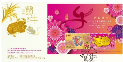
贴有一张邮票小型张并以特别邮戳盖销的纪念封