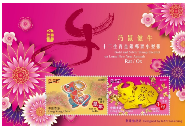
十二生肖金银邮票小型张—巧鼠健牛

子鼠辞旧岁，丑牛贺新禧，十二生肖循环往复，生生不息，寓意岁岁平安，吉祥喜乐。香港邮政特别发行以「巧鼠健牛」为题的十二生肖金银邮票小型张，生肖邮票上的巧鼠与健牛分别以银箔和金片制作，熠熠生辉，气派尽显，顺祝大众来年如健牛般身体健康。