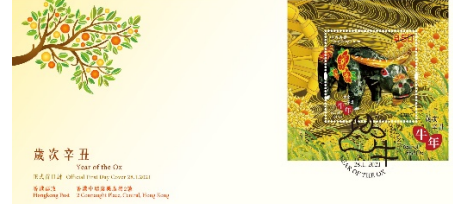
贴有一张丝绸邮票小型张并以特别邮戳盖销的首日封