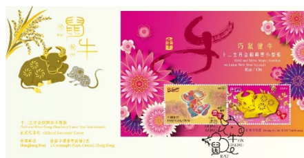
贴有一张邮票小型张并以特别邮戳盖销的纪念封 (珍藏版)