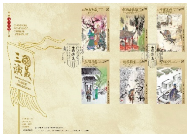
已盖销首日封连一套六枚邮票