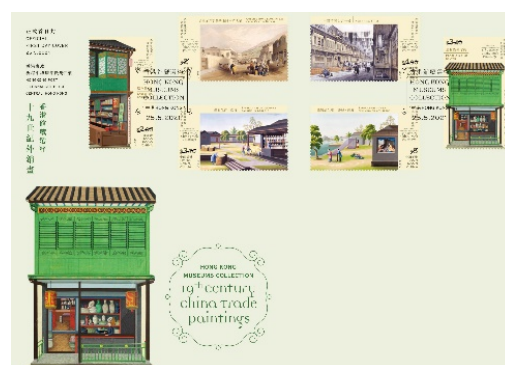
已盖销首日封连一套六枚邮票