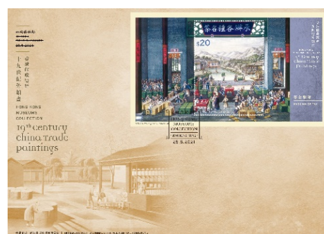
已盖销珍藏封连$20 邮票小型张