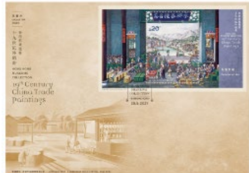
贴有一张 20 元邮票小型张的已盖销珍藏封 (以特别邮戳盖销)