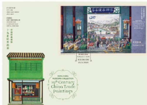
贴有一张 20 元邮票小型张的已盖销首日封 (以特别邮戳盖销)