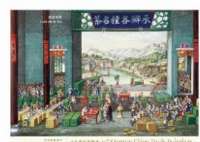
邮资已付图片卡 (空邮邮资) (附有一套八款图片卡)