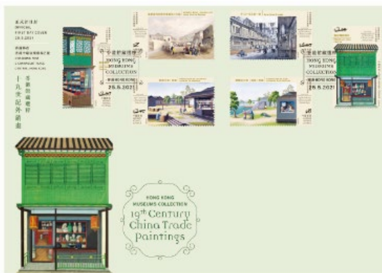
贴有一套六款面值邮票的已盖销首日封 (以特别邮戳盖销)