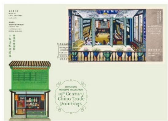
贴有一张 10 元邮票小型张的已盖销首日封 (以特别邮戳盖销)