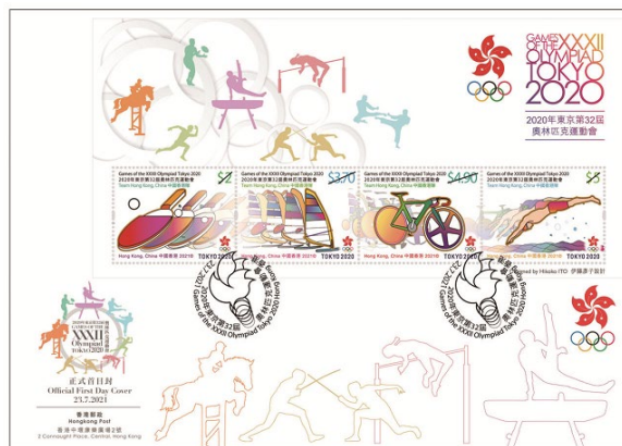
贴有一张小全张的已盖销首日封 (以特别邮戳盖销)