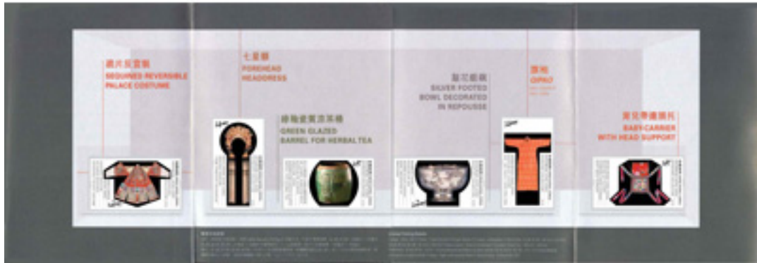
套摺(內外設計圖樣)