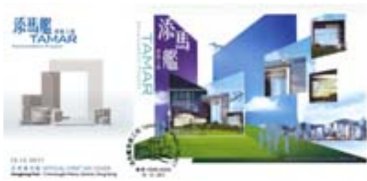
已蓋銷首日封連郵票小型張