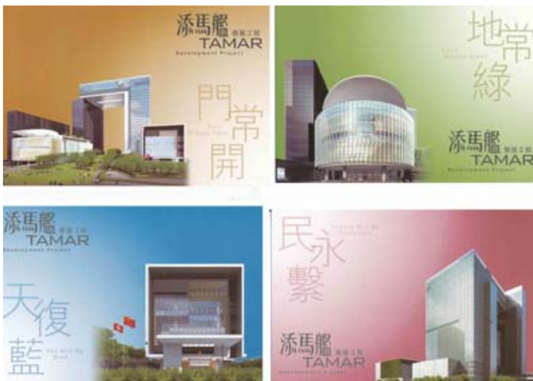
郵資已付明信片(空郵郵資)