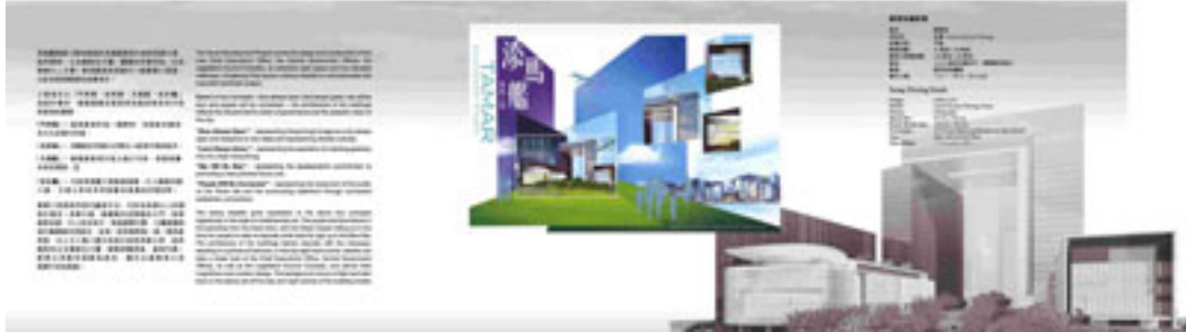
套摺(內外設計圖樣)