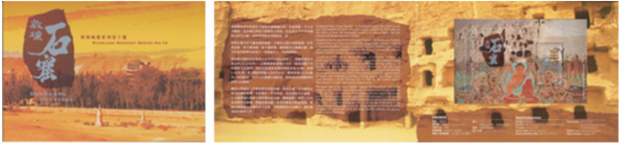
紀念套摺 (內外設計圖樣)