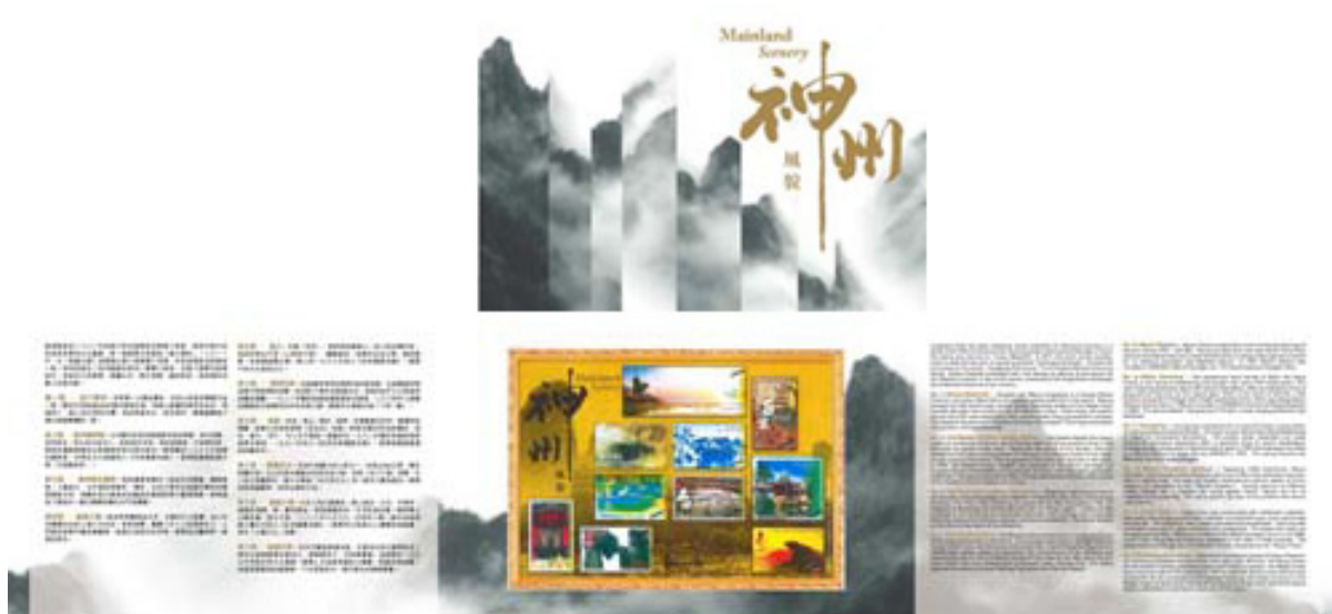
套摺 (內外設計圖樣)