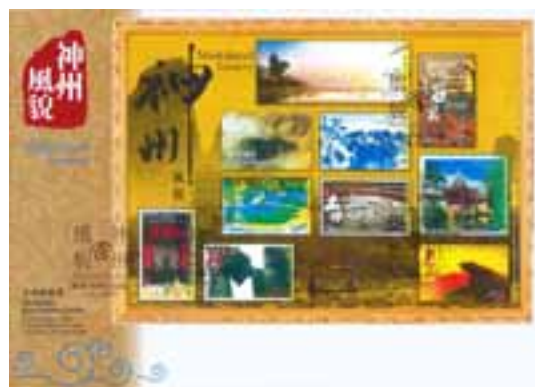
已蓋銷紀念封(珍藏版)連郵票小型張