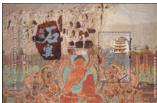
"神州風貌系列第十號 - 敦煌石窟" 郵票小型張

"神州風貌系列第十號：敦煌石窟" 郵票小型張和 "神州風貌全系列" 郵票小型張以及相關集郵品將於二〇一一年八月二日（星期二）推出發售。