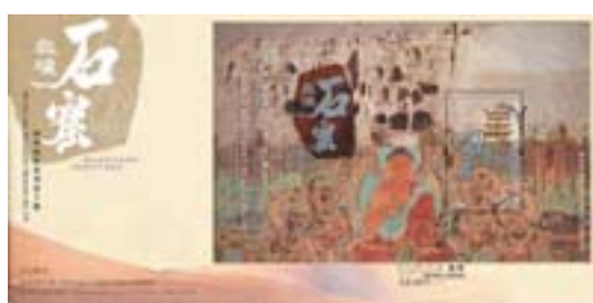
已蓋銷首日封連郵票小型張

郵票小型張的上半部為莫高窟的外觀，恢弘壯麗，下半部為石窟內的佛教壁畫，色彩雖經千百年風霜，但仍透出昔日絢麗；左右兩邊綴以銀線勾勒的飛天仙女圖，飄逸靈動。郵票上方為莫高窟的九層樓，附建於第 96 窟，是莫高窟最高的建築物。郵票小型張展示石窟的非凡氣勢，彰顯佛教的文化魅力，藉以歌頌敦煌藝術之美。