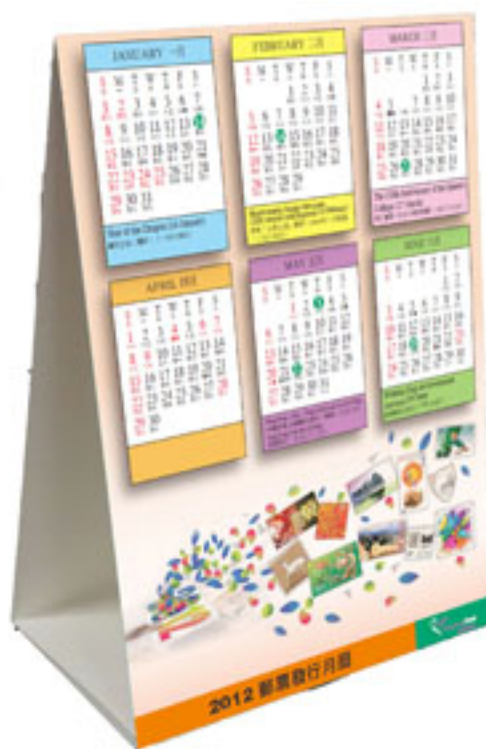
二〇一二年特別郵票月曆卡