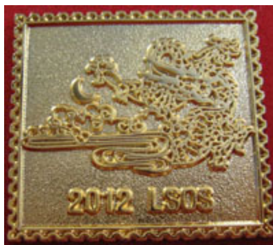
歲次壬辰(龍年)金屬襟章