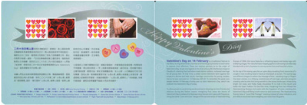
套摺(內外設計圖樣)