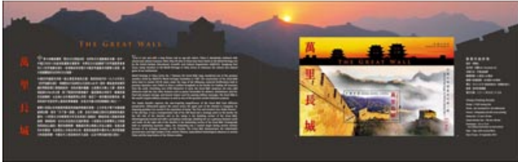
套摺(內外設計圖樣)