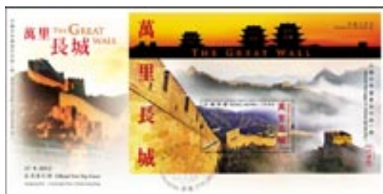
已蓋銷首日封連郵票小型張