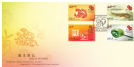
已蓋銷首日封連一套四枚郵票