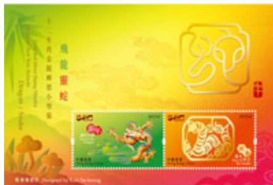
十二生肖金銀郵票小型張 - 飛龍靈蛇

香港郵政將於二〇一三年一月二十六日(星期六)發行"歲次癸巳(蛇年)"特別郵票,並於同日推出"十二生肖金銀郵票小型張—飛龍靈蛇"。