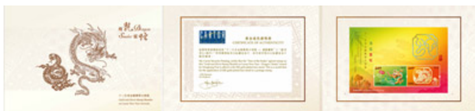
套摺(內外設計圖樣)