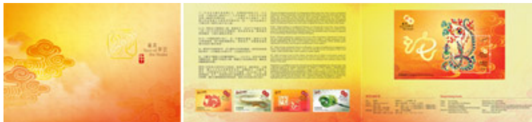
套摺(內外設計圖樣)