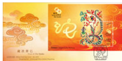
已蓋銷首日封(珍藏版)連郵票小型張