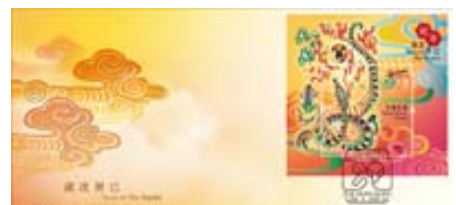
已蓋銷首日封(珍藏版)連絲綢郵票小型張