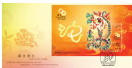
已蓋銷首日封連郵票小型張