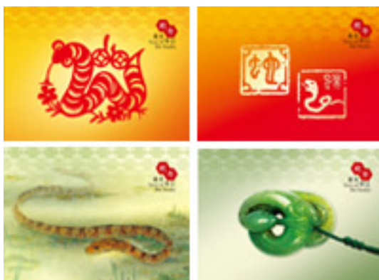
郵資已付賀年卡(空郵郵資)