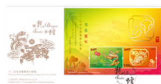
肖紀念封(珍藏版)連郵票小型張