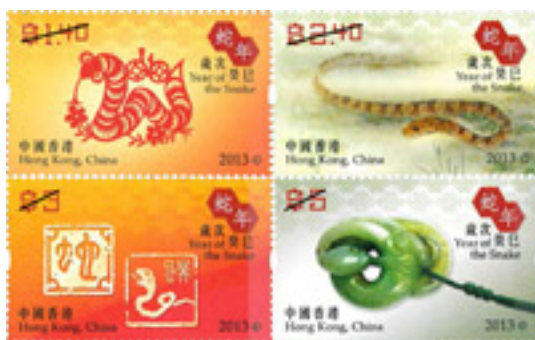
歲次癸巳(蛇年) - 郵票