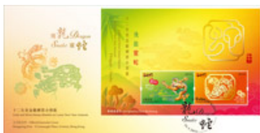
已蓋銷紀念封連郵票小型張