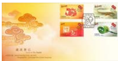
已蓋銷首日封(珍藏版)連一套四枚郵票