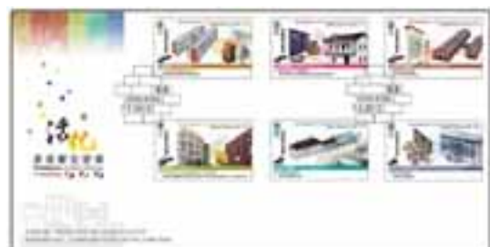
已蓋銷首日封連一套六枚郵票