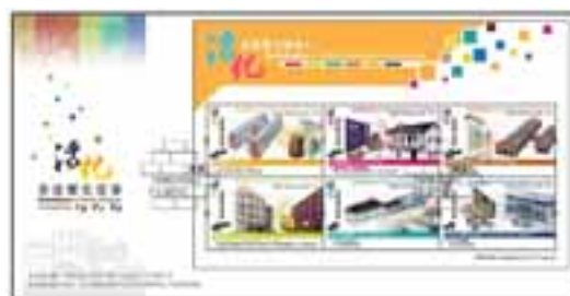
已蓋銷首日封連小全張