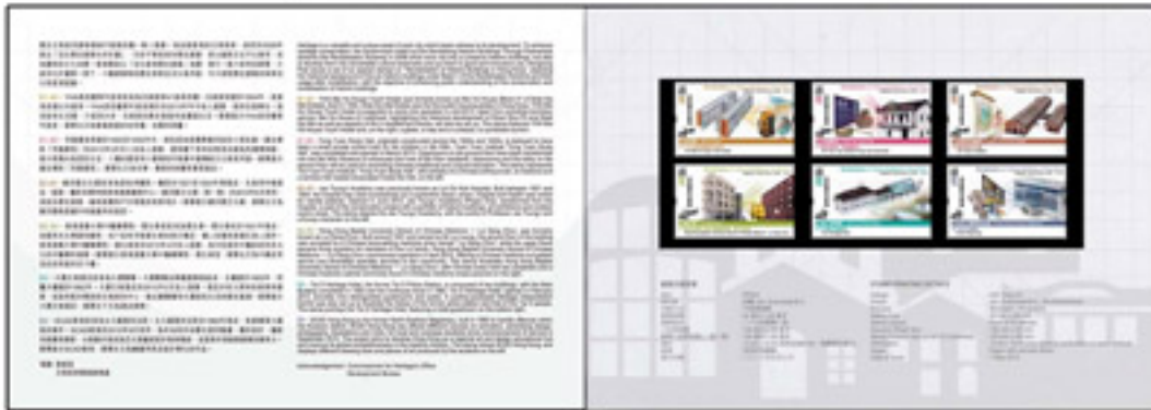
套摺(內外設計圖樣)