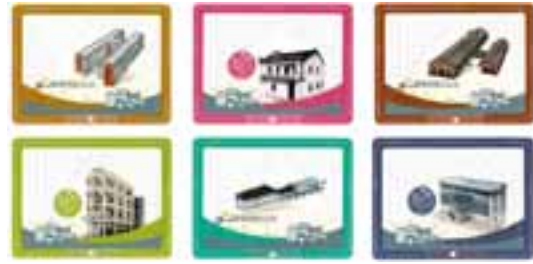
郵資已付圖片卡(空郵郵資)