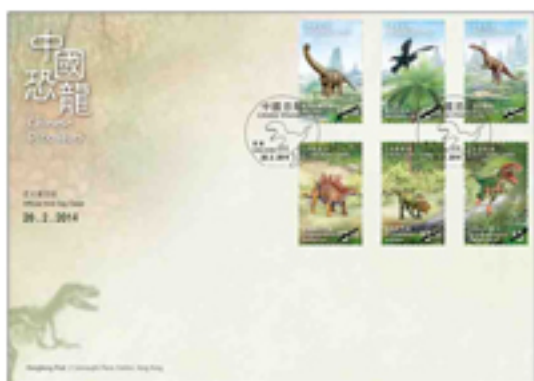
已蓋銷首日封連一套六枚郵票 (特別郵戳)