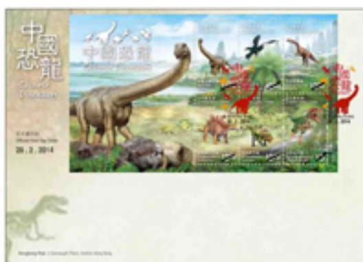
已蓋銷首日封連小全張 (彩色郵戳)