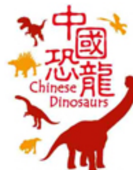
香港 HONG KONG 20.2.2014 彩色郵戳