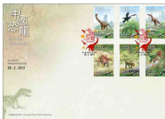
已蓋銷首日封連一套六枚郵票 (彩色郵戳)