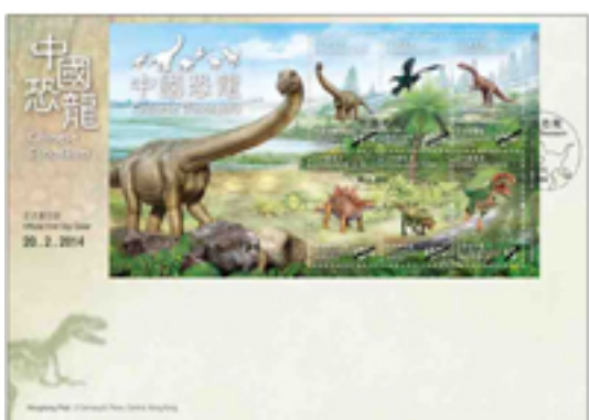
已蓋銷首日封連小全張 (特別郵戳)