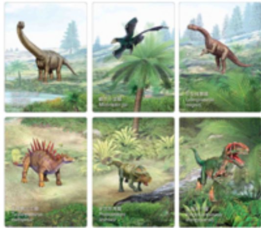
郵資已付圖片卡(空郵郵資) (3D 特別效果)