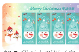
$3.7 郵票小型張 (自動黏貼)