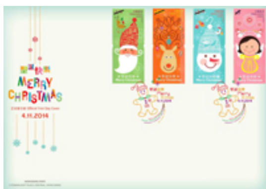
已蓋銷首日封連一套四枚背膠郵票並以彩色郵戳蓋銷的首日封