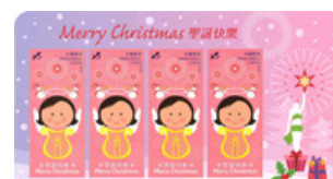
$5 郵票小型張 (自動黏貼)