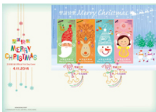
已蓋銷首日封連一張背膠小全張並以彩色郵戳蓋銷的首日封