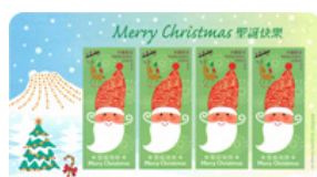
$1.7 郵票小型張 (自動黏貼)