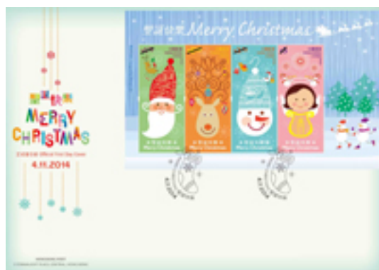
已蓋銷首日封連一張背膠小全張並以特別郵戳蓋銷的首日封