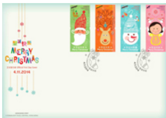
已蓋銷首日封連一套四枚背膠郵票並以特別郵戳蓋銷的首日封