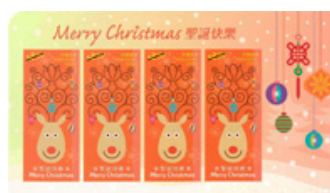
$2.9 郵票小型張 (自動黏貼)