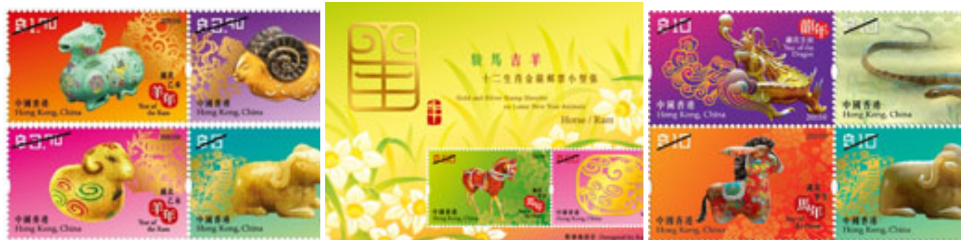
歲次乙未(羊年) - 郵票