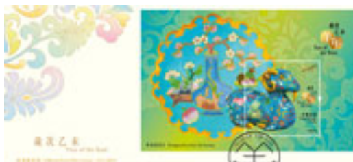
已蓋銷首日封(珍藏版)連一張面值 10 元的郵票小型張