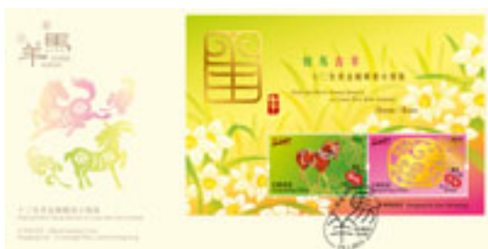
已蓋銷紀念封連一張郵票小型張