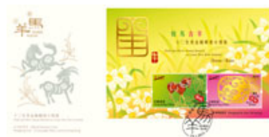
已蓋銷紀念封(珍藏版)連一張郵票小型張