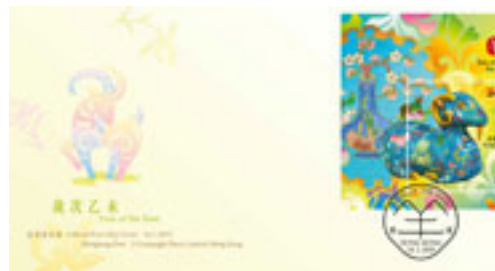
已蓋銷首日封連一張絲綢郵票小型張