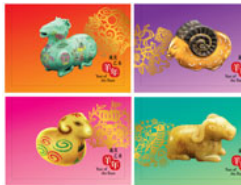
郵資已付生肖賀年卡(空郵郵資)