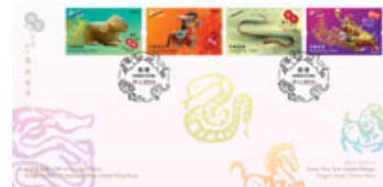
已蓋銷紀念封連一套四枚郵票