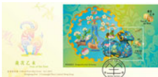
已蓋銷首日封連一張面值 10 元的郵票小型張