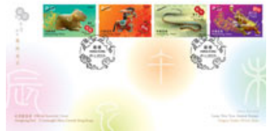
已蓋銷紀念封(珍藏版)連一套四枚郵票