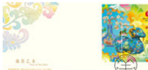
已蓋銷首日封(珍藏版)連一張絲綢郵票小型張