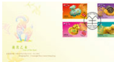
已蓋銷首日封連一套四枚郵票