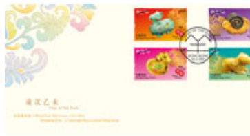
已蓋銷首日封(珍藏版)連一套四枚郵票