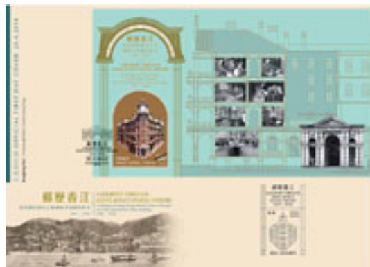
已蓋銷首日封連郵票小型張