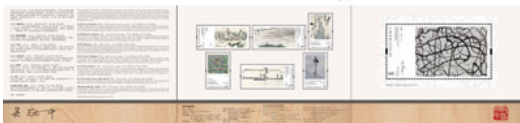
套摺(封面及內頁設計圖樣)