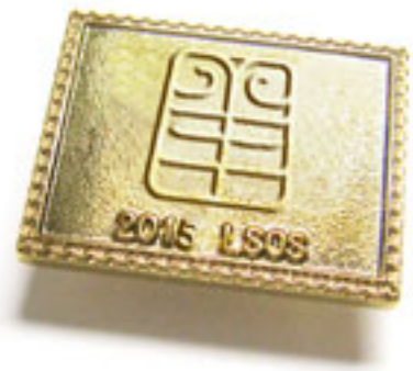
歲次乙未（羊年）金屬襟章