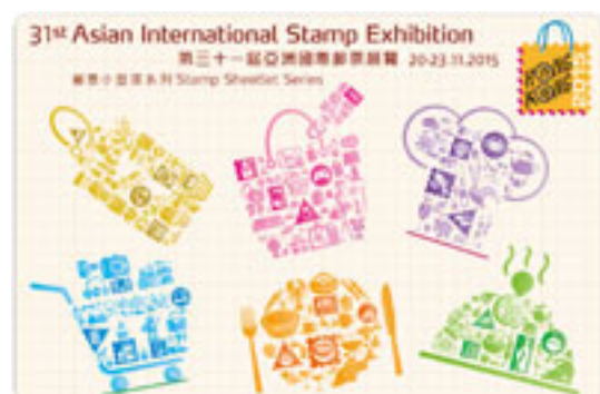
"香港 2015 — 第三十一屆亞洲國際郵票展覽"郵票小型張八達通套