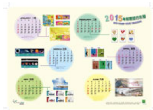
二〇一五年郵票發行年曆卡