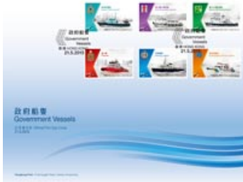
貼有一套六枚郵票並以特別郵戳蓋銷的首日封