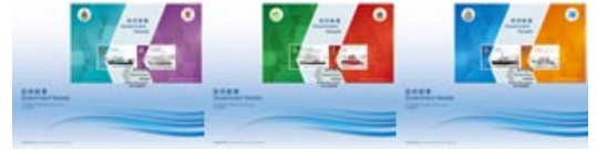
一套三個分別貼有來自珍貴郵票小冊子郵票小型張並以特別郵戳蓋銷的首日封