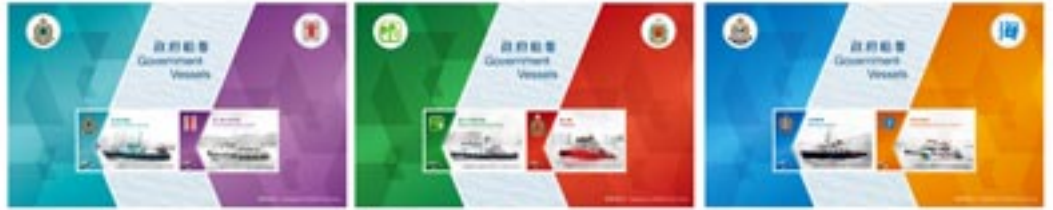
珍貴郵票小冊子內附三張郵票小型張