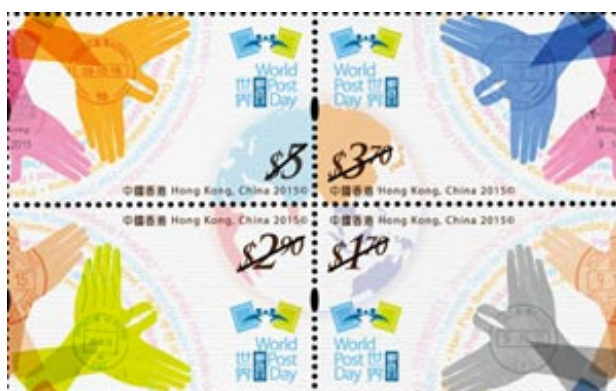
圖二：重新組合的郵票構圖