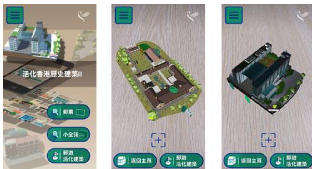
「香港郵政郵票」流動應用程式

「活化香港歷史建築 II」郵票首次加入 AR（擴增實境）技術，讓你透過「香港郵政郵票」流動應用程式，看到郵票中建築物的立體模型，還可查看建築物的 360 度相片，恍如置身其中。建築物立體模型的背景更會按日間、黃昏和晚間而實時改變，為你帶來全新的集郵體驗。