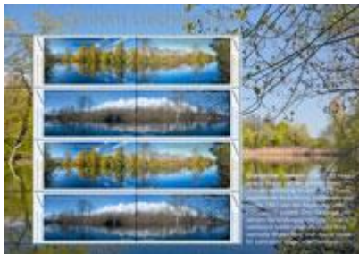
小版張 (LI126) $70.00