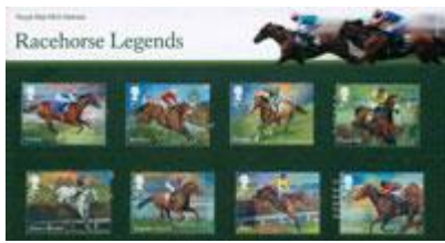
套摺 (BR375) $113.00