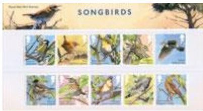
套摺 (BR377) $78.00