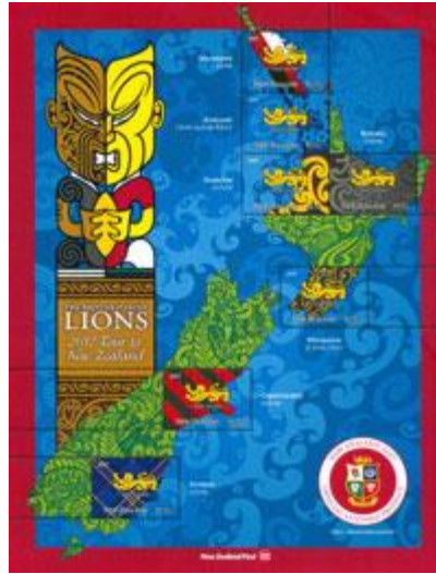
郵票小型張 (NZ281) $113.00