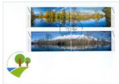
已蓋銷首日封連郵票 (LI127) $44.00