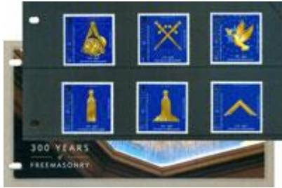
套摺 (IM142) $94.00