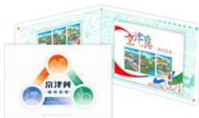
套摺 (CH163) $41.00