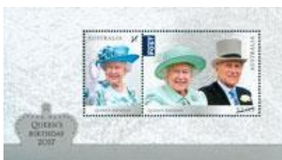
小全張 (AU407) $26.00