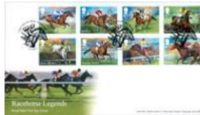
已蓋銷首日封連郵票 (BR376) $133.00