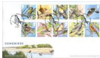
已蓋銷首日封連郵票 (BR378) $92.00