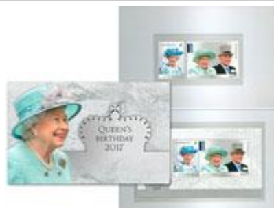
套摺 (AU408) $54.00