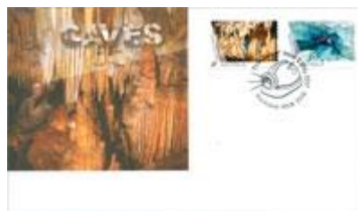
已蓋銷首日封連郵票 (自動黏貼) (AU410) $15.00