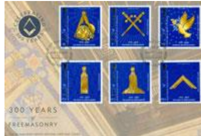
已蓋銷首日封連郵票 (IM143) $93.00