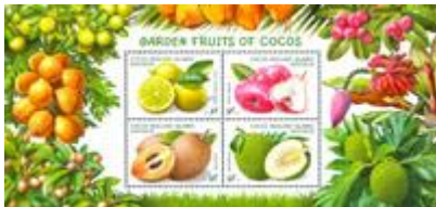
小全張 (AU412) $40.00