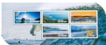
小全張 (NZ282) $73.00