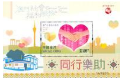
郵票小型張 (MA558) $14.00