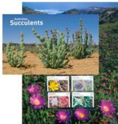
套摺 (AU414) $30.00