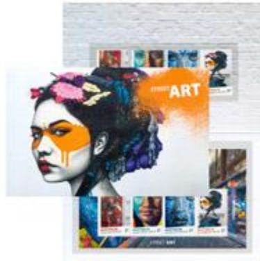
套摺 (AU411) $57.00