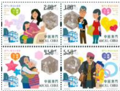
郵票一套四枚 (MA557) $17.00