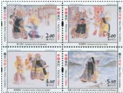
郵票一套四枚 (MA555) $17.00