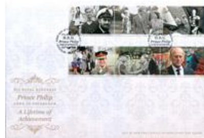
已蓋銷首日封連郵票 (IM145) $87.00