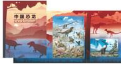
套摺 (CH164) $53.00