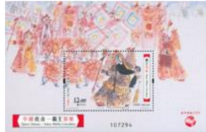
郵票小型張 (MA556) $14.00