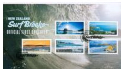
已蓋銷首日封連郵票 (NZ283) $77.00