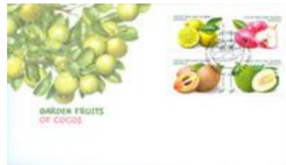
已蓋銷首日封連郵票 (AU413) $42.00