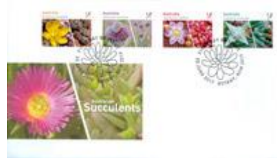
已蓋銷首日封連郵票（自動黏貼）(AU415) $29.00