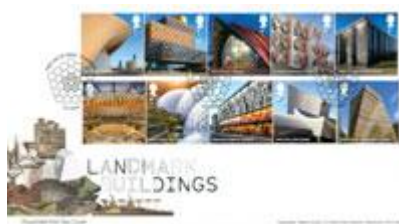
已蓋銷首日封連郵票 (BR384) $92.00