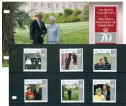
套摺 (IM146) $95.00