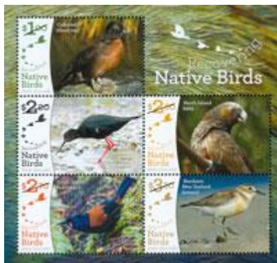
小全張 (NZ285) $73.00