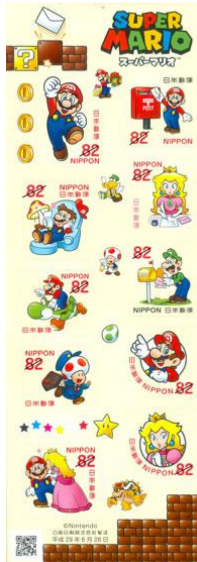
小全張 (JP001) $54.00