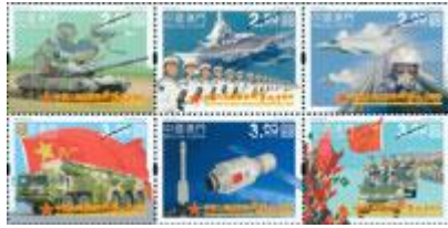
郵票一套六枚 (MA559) $17.00