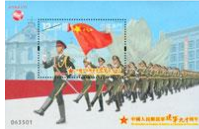
郵票小型張 (MA560) $14.00