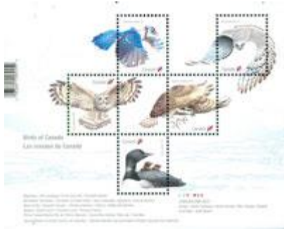
小全張 (CA244) $30.00