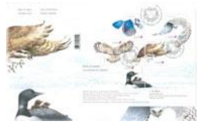
已蓋銷首日封連小全張 (CA245) $37.00