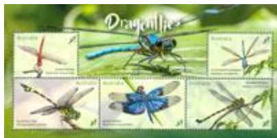
小全張 (AU416) $35.00