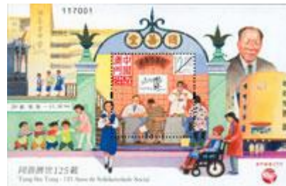
郵票小型張 (MA562) $14.00