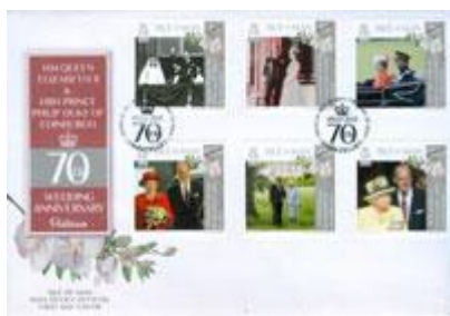
已蓋銷首日封連郵票 (IM147) $94.00