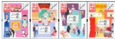
郵票一套四枚 (MA561) $17.00