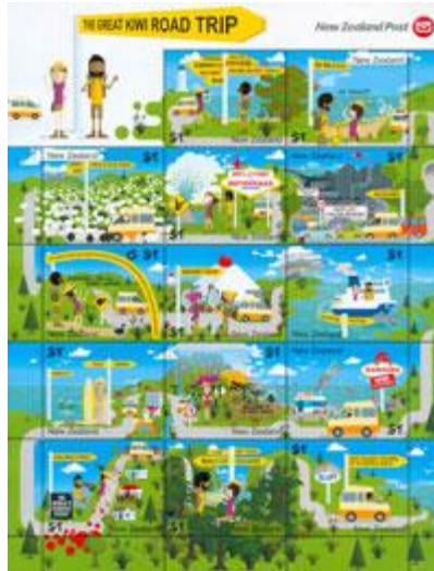
小版張 (NZ284) $89.00