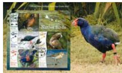
已蓋銷首日封連小全張 (NZ286) $76.00