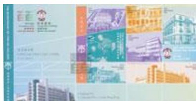
貼有一張郵票小型張並以特別郵戳蓋銷的首日封