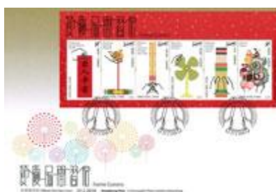
貼有一張小全張並以特別郵戳蓋銷的首日封