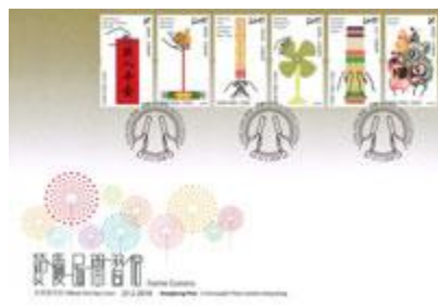
貼有一套六枚郵票並以特別郵戳蓋銷的首日封