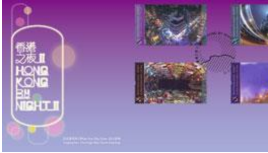
貼有一套四枚郵票並以特別郵戳蓋銷的首日封