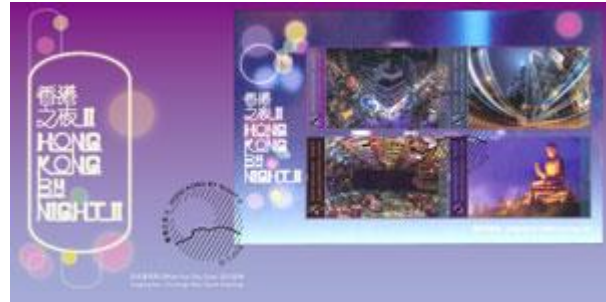
貼有一張小全張並以特別郵戳蓋銷的首日封