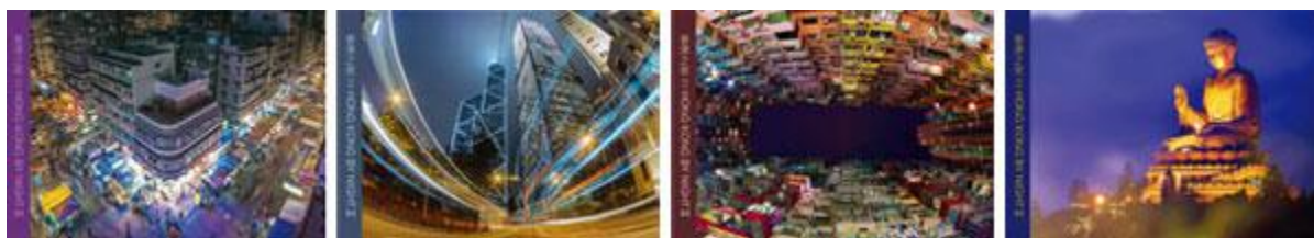
郵資已付圖片卡 (一套四張)