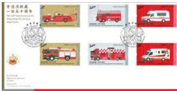
貼有一套六枚郵票並以特別郵戳蓋銷的首日封