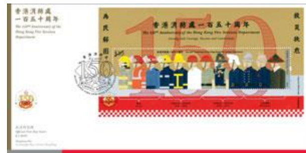
貼有一張郵票小型張並以特別郵戳蓋銷的首日封