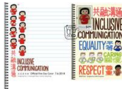
貼有一張郵票小型張並以特別郵戳蓋銷的首日封