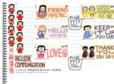
貼有一套六枚郵票並以特別郵戳蓋銷的首日封