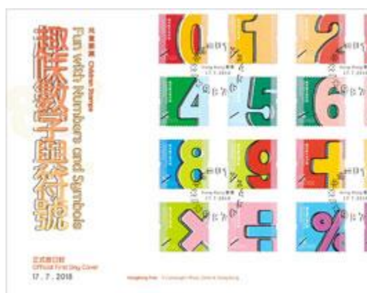
貼有一套十六枚郵票並以特別郵戳蓋銷的首日封