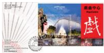
貼有一張 10 元郵票小型張並以特別郵戳蓋銷的首日封