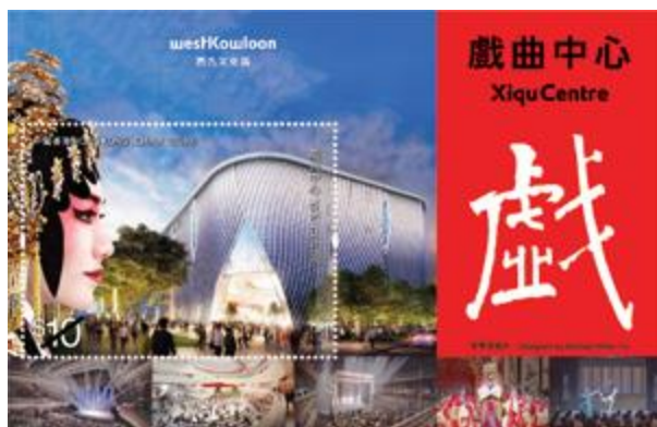
郵票小型張 (嵌有一枚 10 元郵票)