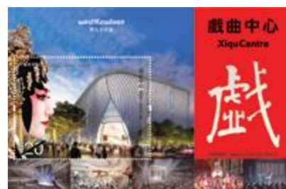
郵票小型張 (以燙壓和壓印技術印製, 嵌有一枚 20 元郵票)