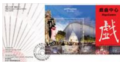
貼有一張 20 元郵票小型張並以特別郵戳蓋銷的首日封