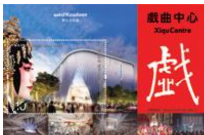
郵票小型張 (嵌有一枚 10 元郵票)