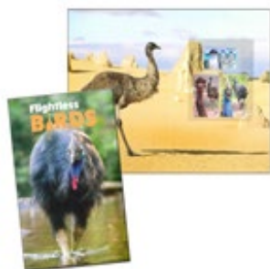
套摺 (AU462) $30.00