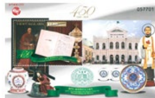
郵票小型張 (MA608) $15.00