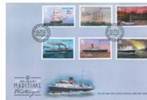
已蓋銷首日封連郵票 (IM163) $90.00