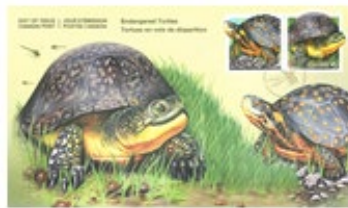
已蓋銷首日封連郵票 (CA266) $20.00