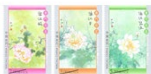
郵票一套三枚 (MA609) $15.00