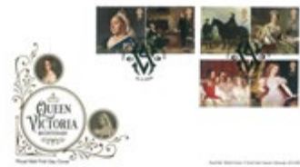
已蓋銷首日封連郵票 (BR424) $105.00