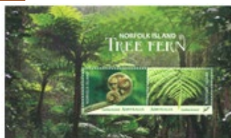
小全張 (AU460) $20.00