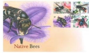
已蓋銷首日封連郵票 (AU465) $30.00