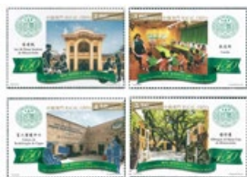
郵票一套四枚 (MA607) $20.00