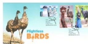
已蓋銷首日封連郵票 (AU463) $30.00