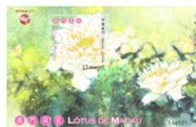
郵票小型張 (MA610) $15.00