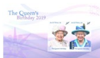
小全張 (AU461) $25.00