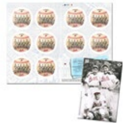
郵票小冊子連一套十枚郵票 (自動黏貼)(CA267) $60.00