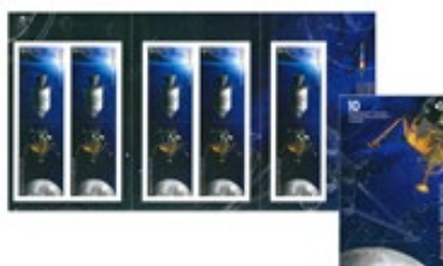
郵票小冊子連一套十枚郵票 (自動黏貼) (CA269) $60.00