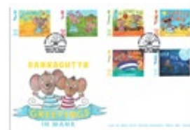
已蓋銷首日封連郵票 (IM166) $90.00