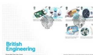
已蓋銷首日封連郵票 (BR426) $110.00