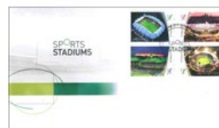
已蓋銷首日封連郵票 (AU468) $30.00