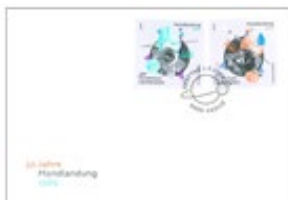
已蓋銷首日封連郵票 (LI142) $45.00