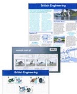
套摺 (BR425) $145.00