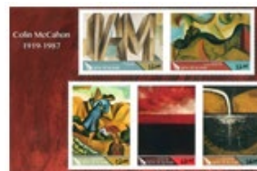
小全張 (NZ310) $75.00