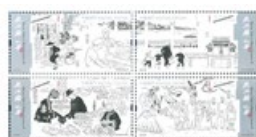
郵票一套四枚 (MA611) $20.00