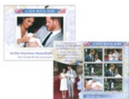
小全張 (IM164) $85.00