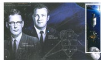
已蓋銷首日封連郵票 (CA270) $20.00