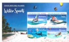
小全張 (AU466) $40.00