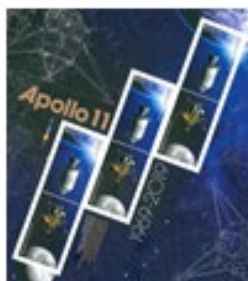
小全張 (CA268) $40.00