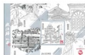
郵票小型張 (MA612) $15.00