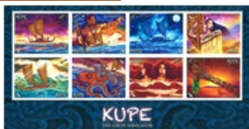
小全張 (NZ309) $65.00