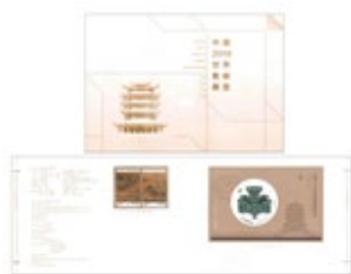
套摺 (CH180) $30.00