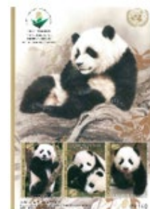
小全張 (UN119) $55.00