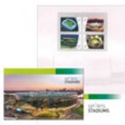
套摺 (AU467) $30.00