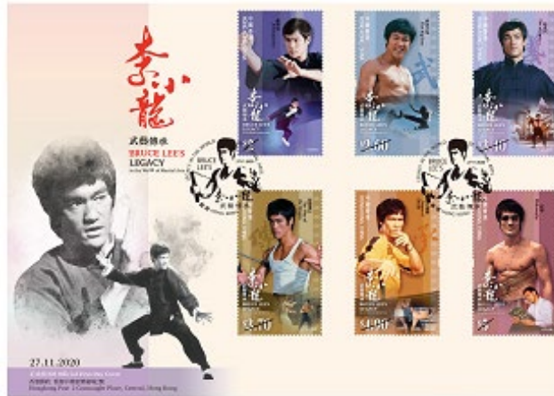
貼有一套六枚郵票的首日封 （以相關的特別郵戳蓋銷）