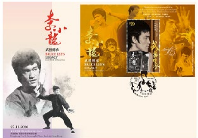
貼有一張面值 20 元郵票小型張的首日封 （以相關的特別郵戳蓋銷）