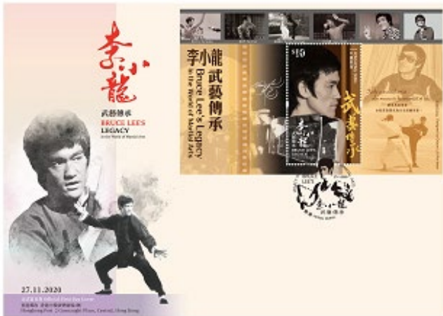
貼有一張面值 10 元郵票小型張的首日封 （以相關的特別郵戳蓋銷）