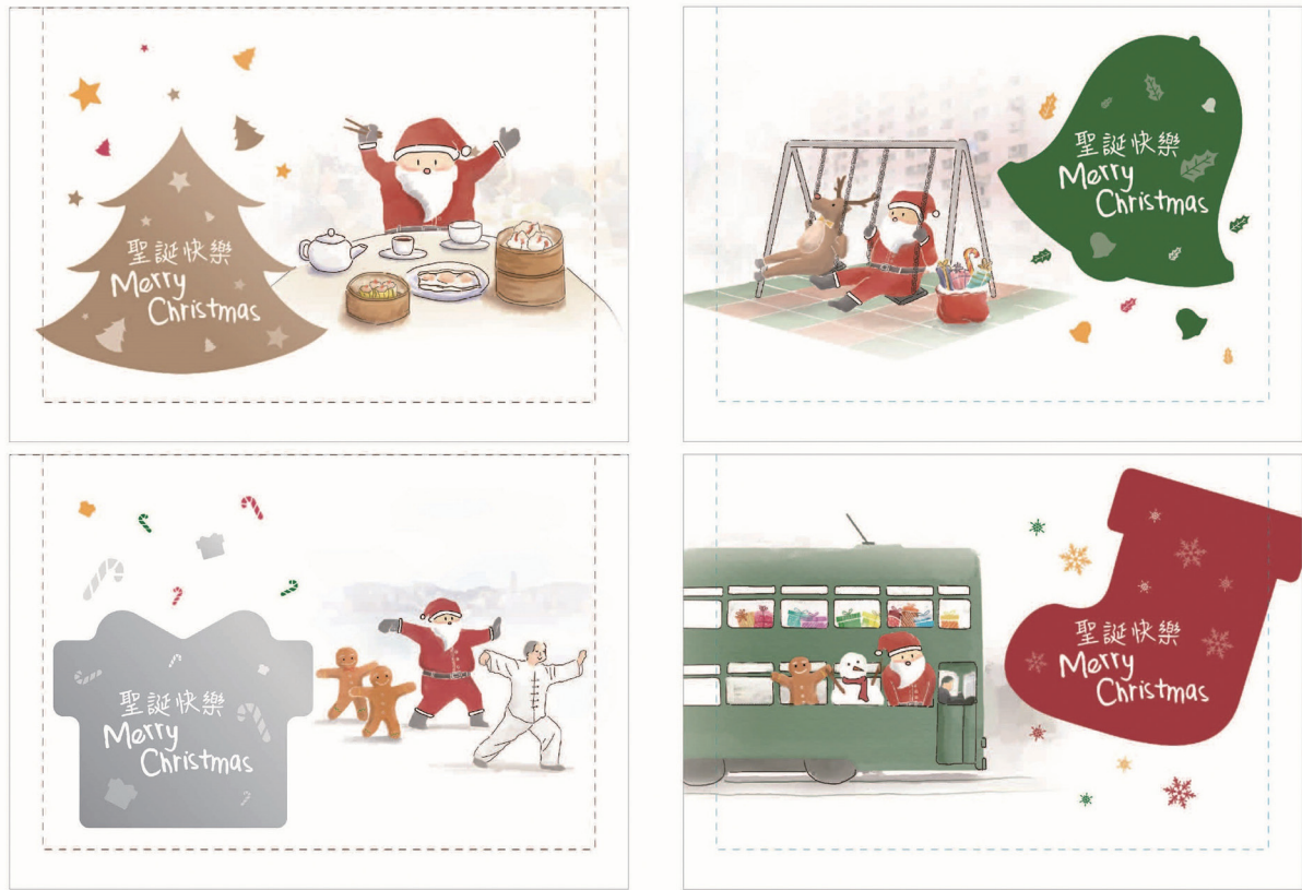
郵資已付聖誕卡（空郵郵資）一套四款