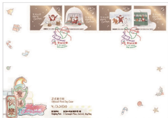
貼有一套四枚背膠郵票的首日封 （以相關的彩色郵戳蓋銷）