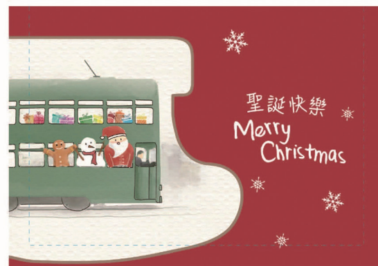
郵資已付聖誕卡（本地郵資）一套四款