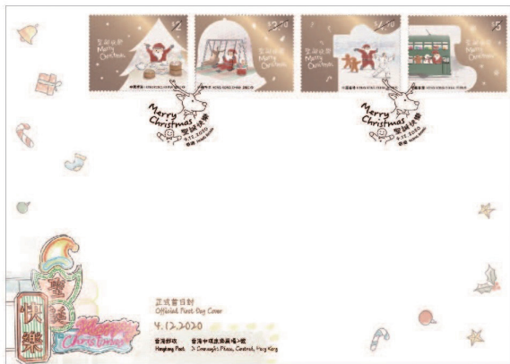
貼有一套四枚背膠郵票的首日封 （以相關的特別郵戳蓋銷）