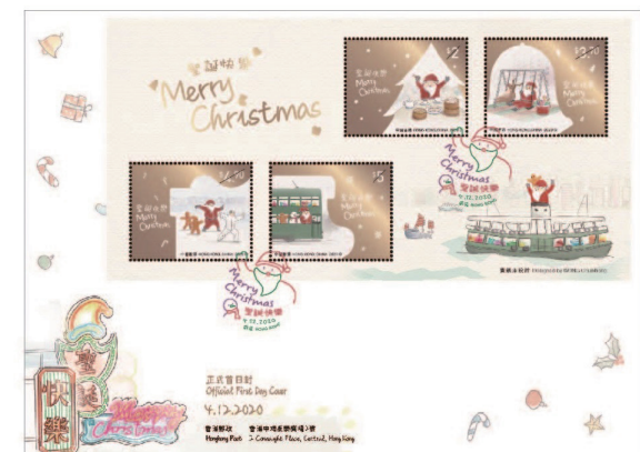
貼有一張背膠小全張的首日封 （以相關的彩色郵戳蓋銷）