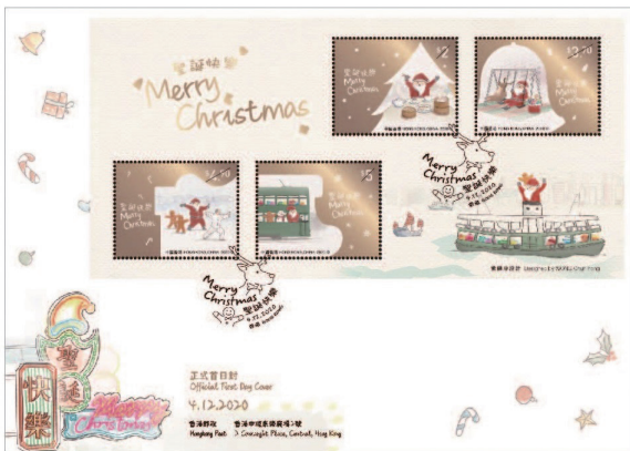
貼有一張背膠小全張的首日封 （以相關的特別郵戳蓋銷）