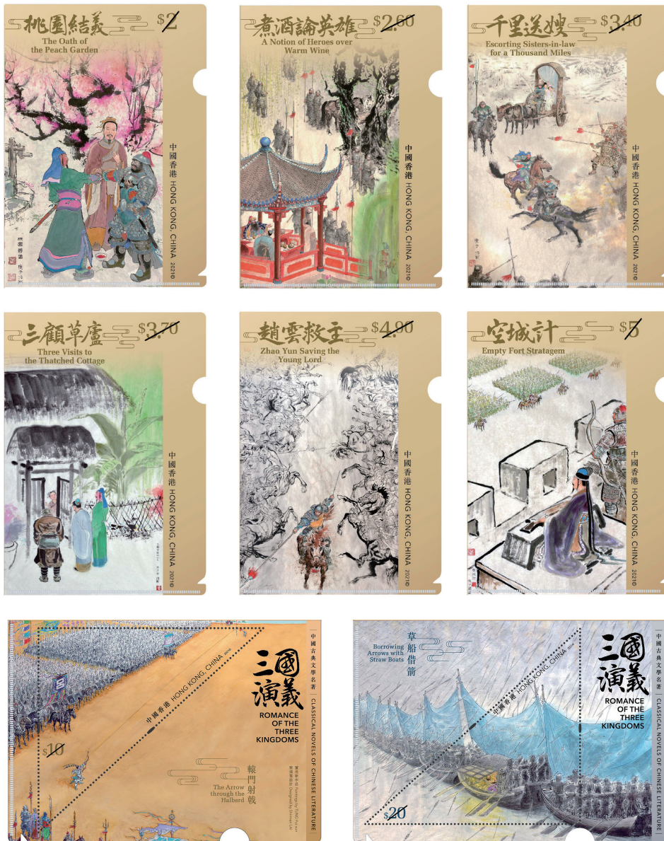
「中國古典文學名著 — 《三國演義》」 特別郵票 A4 文件套 (一套 8 款)

^雙重獎賞計劃已包括2021年「郵品訂購服務」之「快人一步」獎賞計劃中消費每港幣1元即獲享1分的基本獎賞