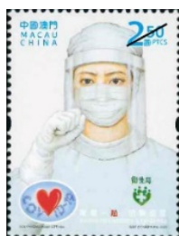
郵票一枚 (MA647) $5.00