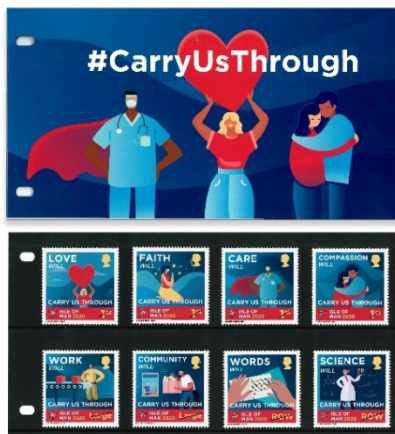
套摺 (IM174) $110.00