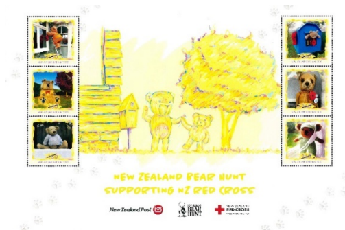
小全張 (NZ318) $100.00

至於熱愛大自然的集郵人士，由澳洲郵政推出的「科科斯（基林）群島：鯉鳥」、「沙漠的藝術」和「諾福克島：諾福克藍牛」等郵品實在不容錯過。