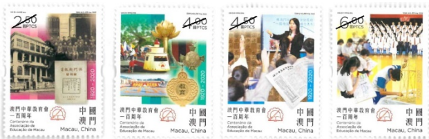
郵票一套四枚 (MA653) $25.00