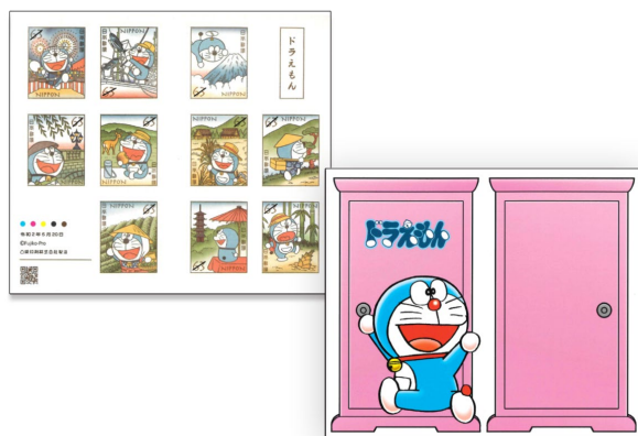
郵票小冊子連一套十枚郵票(貼紙式)(JP002) $55.00