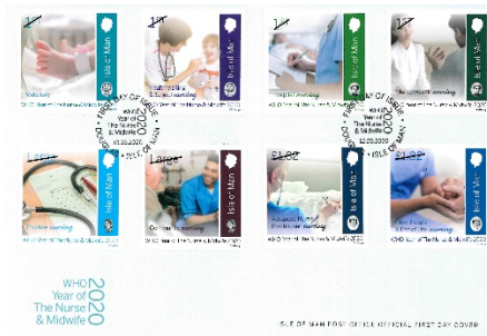
套摺 (IM175) $115.00