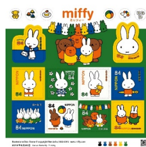
84日圓小全張(貼紙式)(JP005) $70.00

因應2019冠狀病毒病觸發的公共衛生危機，澳門郵電和馬恩島郵政分別發行「萬眾一心 抗擊疫情」和「共渡時艱」郵品。新西蘭因疫情封城期間，尋找泰迪熊的小遊戲風靡一時。新西蘭郵政特此發行「新西蘭尋熊樂」郵品，記錄國民如何在這段緊張的時期紓壓解鬱。