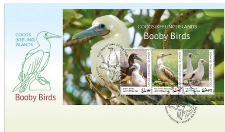
已蓋銷首日封連小全張 (AU490) $35.00