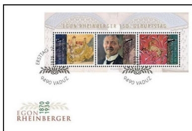
已蓋銷首日封連小全張 (LI152) $80.00