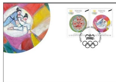
已蓋銷首日封連郵票(LI153) $60.00