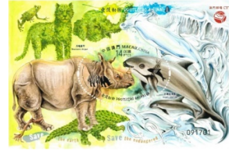
郵票小型張 (MA658) $20.00