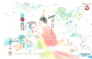
郵票小型張 (MA652) $20.00