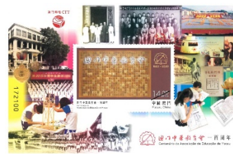
郵票小型張 (MA654) $20.00