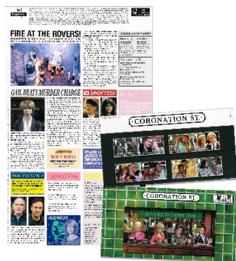
套摺 (BR454) $180.00