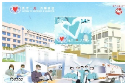
郵票小型張 (MA648) $20.00