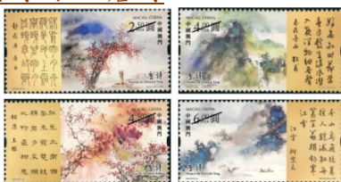
郵票一套四枚 (MA655) $25.00