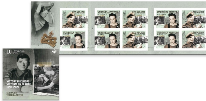
郵票小冊子連一套十枚郵票 (貼紙式) (CA277) $70.00