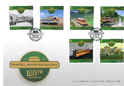
已蓋銷首日封連郵票 (IM176) $110.00