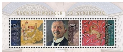
小全張 (LI151) $70.00