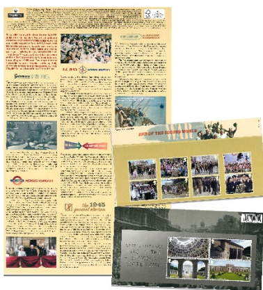
套摺 (BR455) $185.00