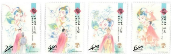
郵票一套四枚 (MA651) $25.00