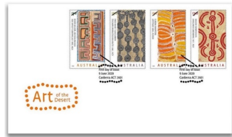
已蓋銷首日封連郵票 (AU492) $45.00