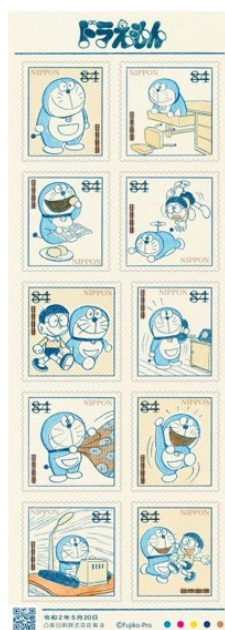
小全張(貼紙式) (JP003) $70.00