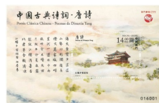
郵票小型張 (MA656) $20.00