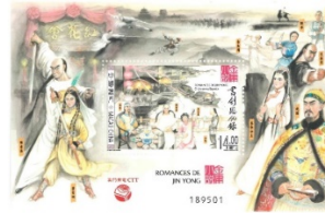
郵票小型張 (MA660) $20.00