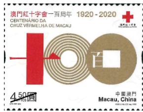
郵票一枚 (MA645) $10.00