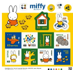
63日圓小全張(貼紙式)(JP004) $55.00