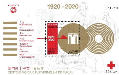
郵票小型張 (MA646) $20.00