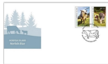
已蓋銷首日封連郵票 (AU494) $25.00

此外，為紀念二次世界大戰結束75周年，英國皇家郵政及新西蘭郵政分別推出「第二次世界大戰結束」和「二戰結束75周年」郵品，讓集郵人士共同回顧歷史上的重要時刻。