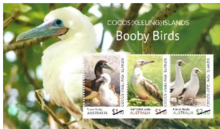
小全張 (AU489) $35.00