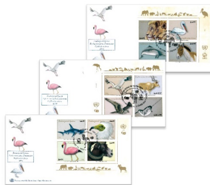
一套三個已蓋銷首日封連郵票小型張 (UN121) $165.00