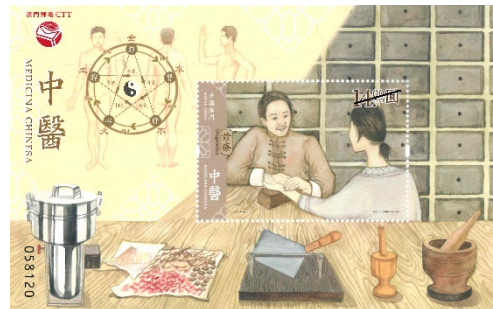
郵票小型張 (MA650) $20.00