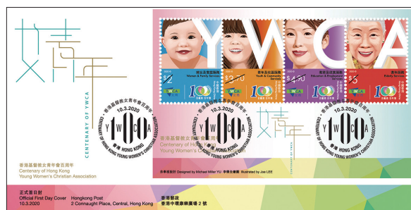
貼有一張小全張 並以相關的特別郵戳蓋銷的首日封