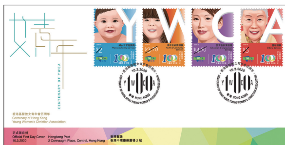
貼有一套四枚郵票 並以相關的特別郵戳蓋銷的首日封