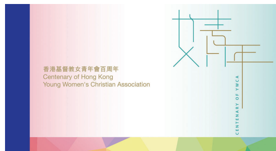
珍貴郵票小冊子 (封面)