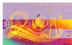
郵票小型張 (MA632) $15.00