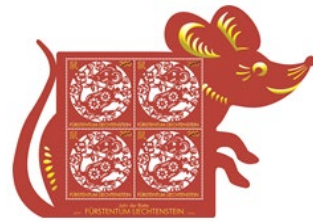
小版張 (LI144) $75.00