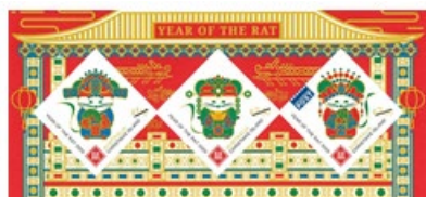
小全張 (AU476) $45.00