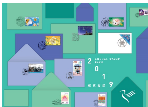
2019年郵票套摺 (港幣 $228)