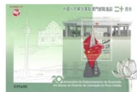
郵票小型張 (MA630) $15.00