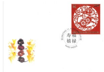
已蓋銷首日封連郵票 (LI145) $30.00