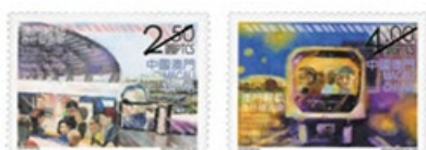
郵票一套兩枚 (MA627) $10.00