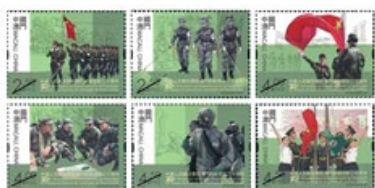
郵票一套六枚 (MA629) $25.00