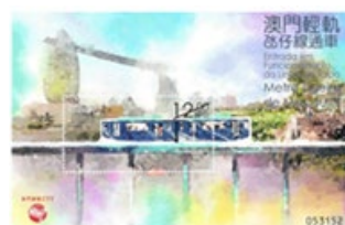
郵票小型張 (MA628) $15.00