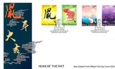
已蓋銷首日封連郵票 (NZ314) $70.00