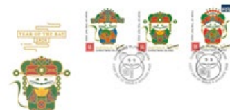
已蓋銷首日封連郵票 (AU477) $45.00