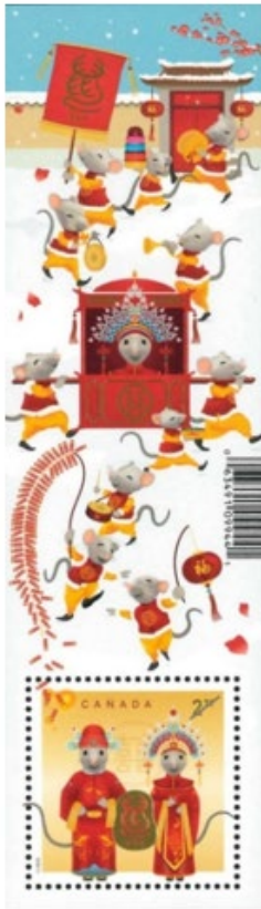
小全張 (CA273) $20.00