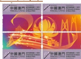
郵票一套四枚 (MA631) $20.00