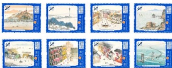
郵票一套八枚 (MA626) $40.00