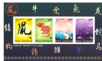
小全張 (NZ313) $65.00