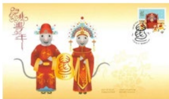
已蓋銷首日封連郵票(CA274) $15.00