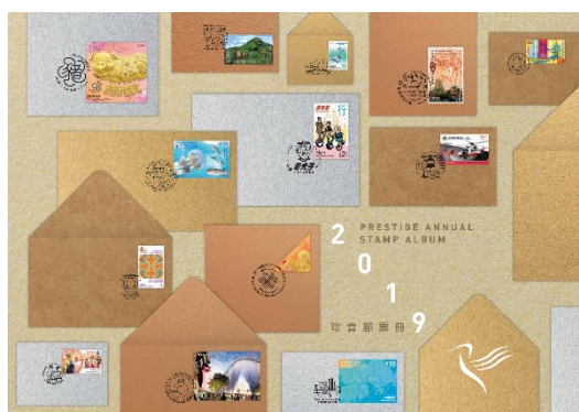
2019年珍貴郵票冊 (港幣 $628)