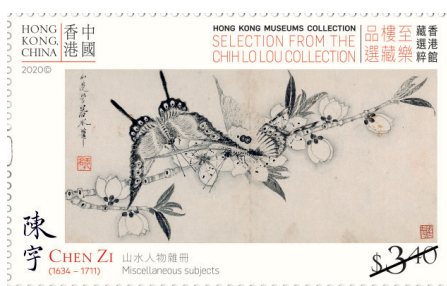
郵票 $3.40 - 陳宇《山水人物雜冊》