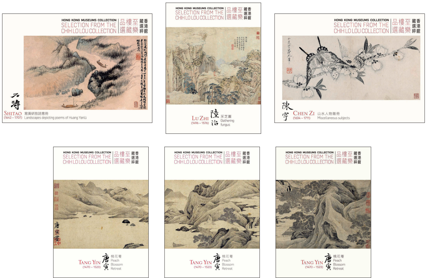
郵資已付圖片卡（一套六張）