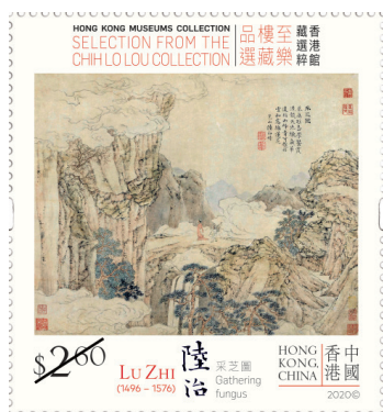
郵票 $2.60 - 陸治《采芝圖》