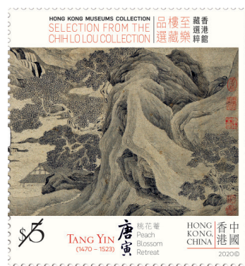
郵票 $3.70、$4.90 及 $5 - 唐寅《桃花菴》