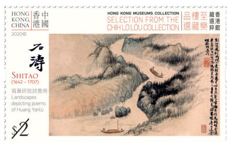
郵票 $2 - 石濤《寫黃研旅詩意冊》