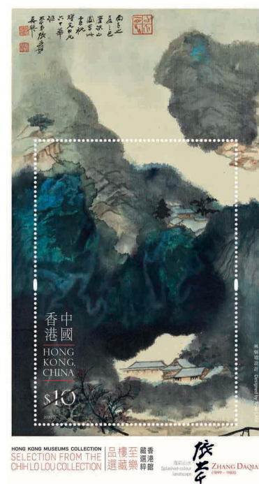
$10 郵票小型張 - 張大千《潑彩山水》