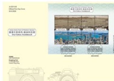
貼有一張小全張的首日封 （以相關的特別郵戳蓋銷）