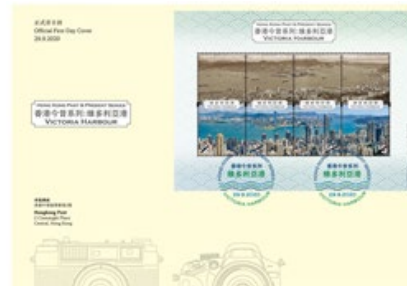
貼有一張小全張的首日封 （以相關的彩色郵戳蓋銷）