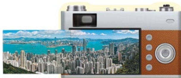
套摺(封面)(附開合式揭蓋)