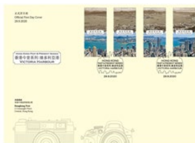
貼有一套四枚郵票的首日封 （以相關的特別郵戳蓋銷）