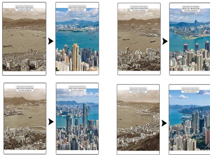
郵資已付圖片卡（附光柵變圖效果）（空郵）（一套四張）