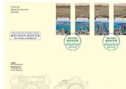
貼有一套四枚郵票的首日封 （以相關的彩色郵戳蓋銷）