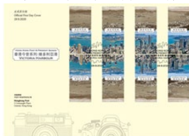
貼有一套四組對倒郵票 而每組設計各不相同的首日封 （以特別郵戳蓋銷）