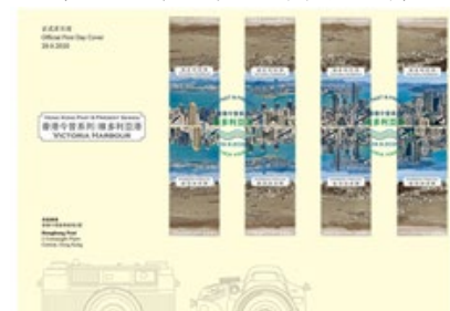
貼有一套四組對倒郵票 而每組設計各不相同的首日封 （以彩色郵戳蓋銷）