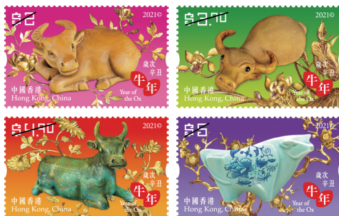
歲次辛丑（牛年）－郵票