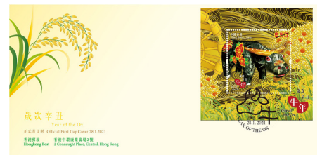
貼有一張絲綢郵票小型張並以特別郵戳蓋銷的首日封 (珍藏版)