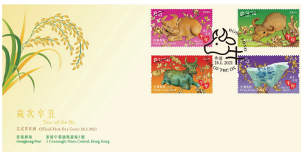
貼有一套四枚郵票並以特別郵戳蓋銷的首日封 (珍藏版)