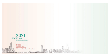
2021年紀念封 (小型尺寸: 220 毫米 x 110 毫米)

全新設計的“2021年紀念封”將會由二〇二一年一月十四日至十二月三十一日在38間集郵局和香港郵政網上購物坊-「郵購網」發售，每個售價二元。