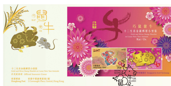
貼有一張郵票小型張並以特別郵戳蓋銷的紀念封 (珍藏版)