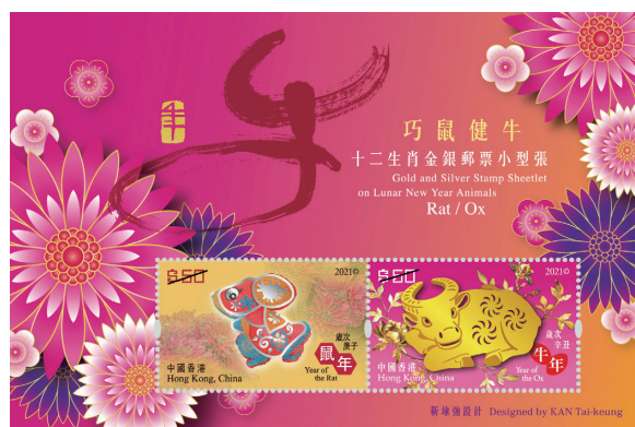
十二生肖金銀郵票小型張—巧鼠健牛

子鼠辭舊歲，丑牛賀新禧，十二生肖循環往復，生生不息，寓意歲歲平安，吉祥喜樂。香港郵政特別發行以「巧鼠健牛」為題的十二生肖金銀郵票小型張，生肖郵票上的巧鼠與健牛分別以銀箔和金片製作，熠熠生輝，氣派盡顯，順祝大眾來年如健牛般身體健康。