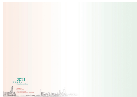
2021年紀念封 (大型尺寸: 265 毫米 x 190 毫米)