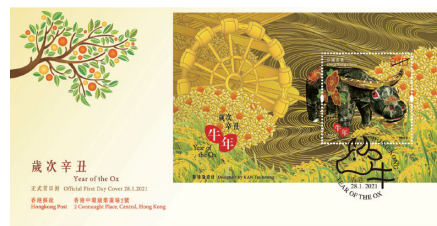
貼有一張面值 10 元的郵票小型張並以特別郵戳蓋銷的首日封