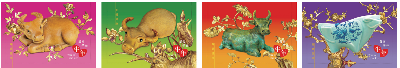
郵資已付生肖賀年卡 (空郵郵資)