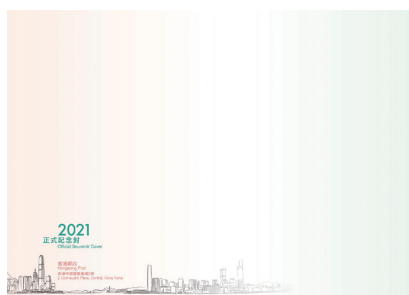
2021年紀念封 (中型尺寸: 228 毫米 x 162 毫米)