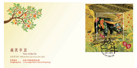
貼有一張絲綢郵票小型張並以特別郵戳蓋銷的首日封