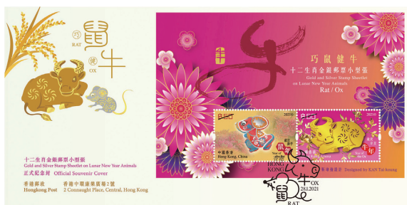
貼有一張郵票小型張並以特別郵戳蓋銷的紀念封