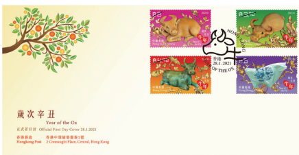
貼有一套四枚郵票並以特別郵戳蓋銷的首日封