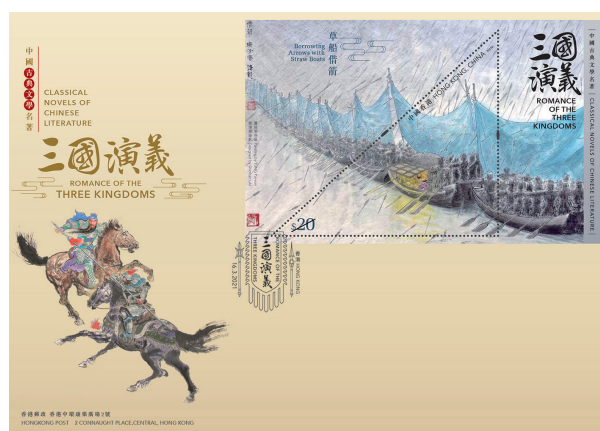
已蓋銷珍藏封連 $20 郵票小型張