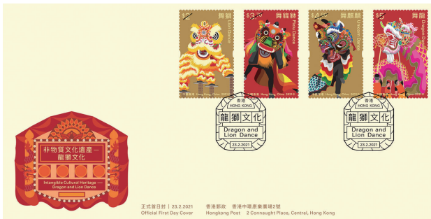
貼有一套四枚郵票並以特別郵戳蓋銷的首日封