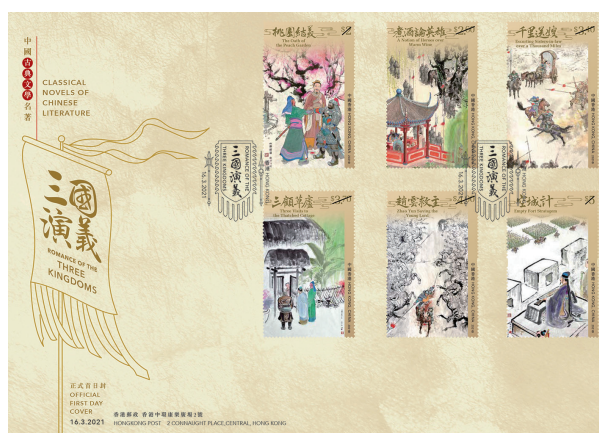
已蓋銷首日封連一套六枚郵票