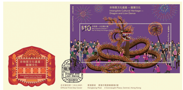
貼有一張 $10 郵票小型張並以特別郵戳蓋銷的首日封