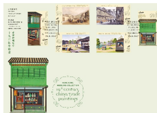
已蓋銷首日封連一套六枚郵票