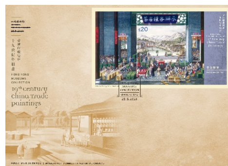
已蓋銷珍藏封連$20 郵票小型張