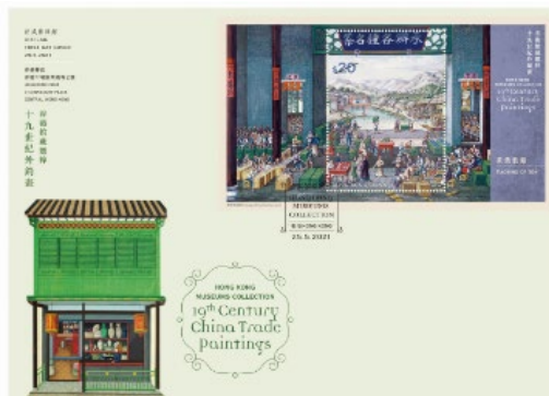
貼有一張 20 元郵票小型張的已蓋銷首日封 (以特別郵戳蓋銷)