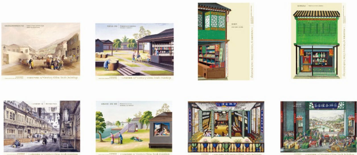
郵資已付圖片卡(空郵郵資) (附有一套八款圖片卡)