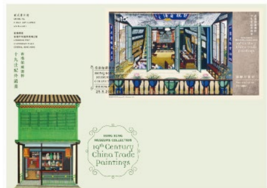
貼有一張 10 元郵票小型張的已蓋銷首日封 (以特別郵戳蓋銷)